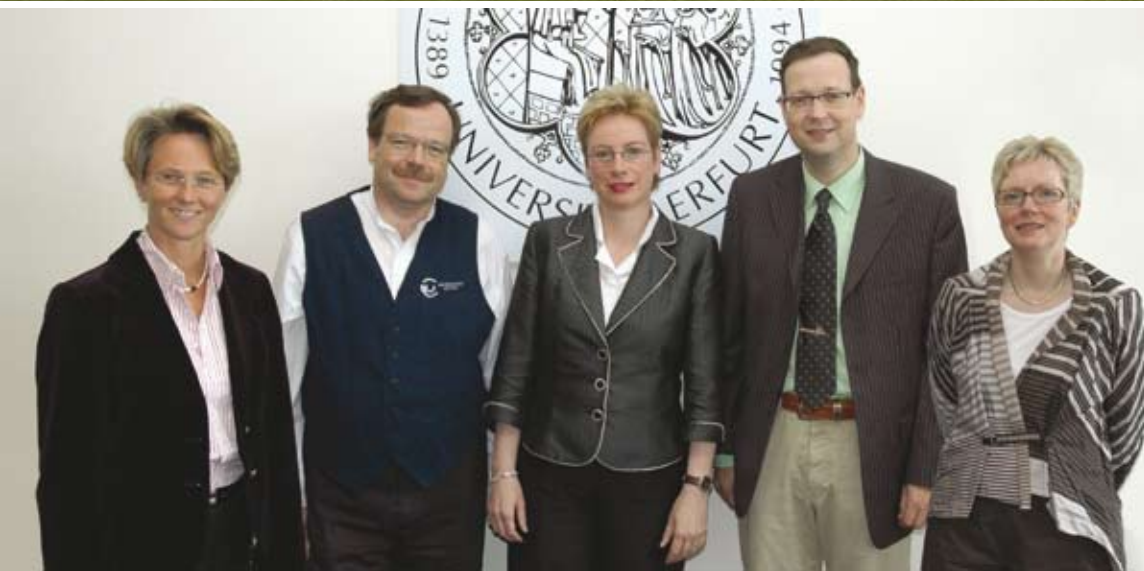
Präsidium der Universität Erfurt