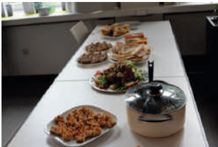
Foto: gemeinsames Fastenbrechen mit Präsentationen über den Ramadan in verschiedenen Ländern (in Kooperation mit Café International)