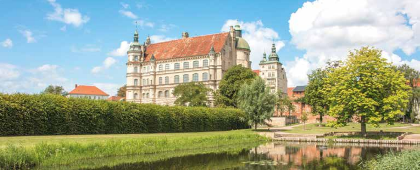
Schloss Güstrow, Foto: © pixs:sell, Adobe Stock