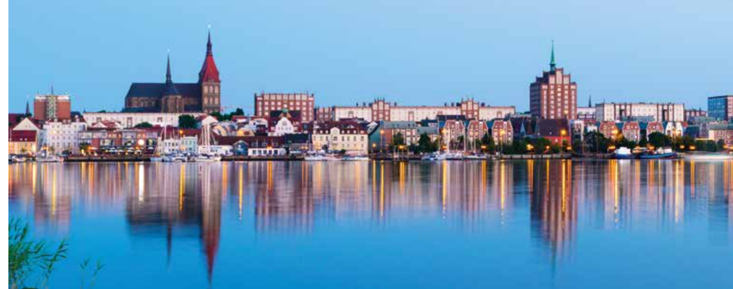
Hafen von Rostock, Foto: © eplisterra, Adobe Stock

Wir speichern und verarbeiten Ihre Daten zum Zweck der Durchführung der Veranstaltung. Ihre Namen, Wohnorte (ohne genaue Adresse) und E-Mail-Adresse geben wir zum Zweck der Bildung von Fahrgemeinschaften und weiteren Absprachen an alle Teilnehmenden weiter, es sei denn, es wird ausdrücklich bei der Anmeldung widersprochen.