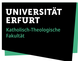
Beispielanwendung Kath.-Theol. Fakultät