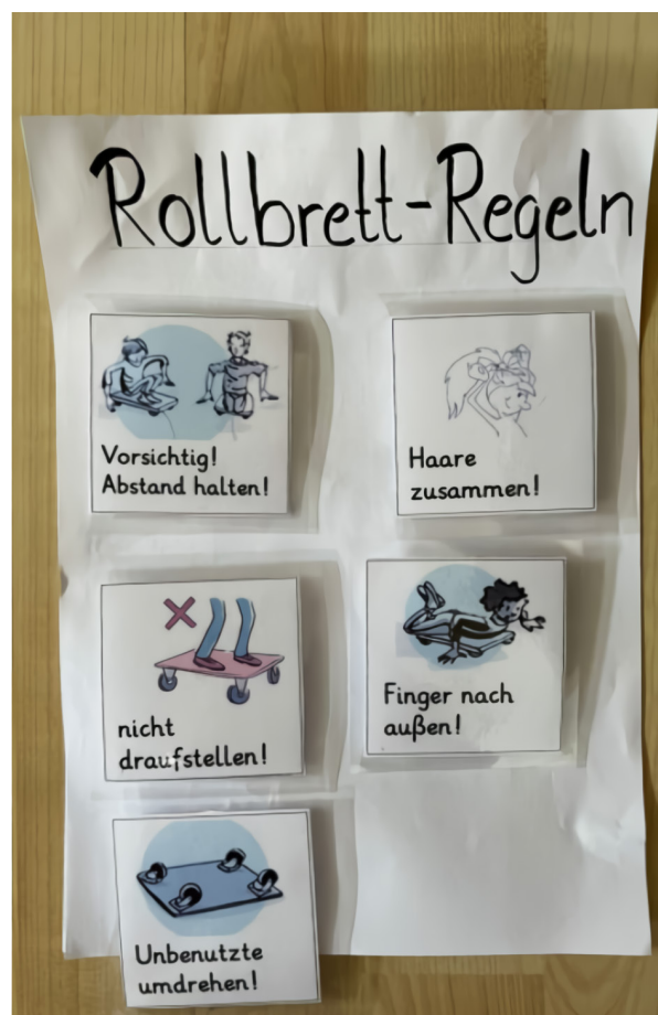
Abbildung 8: Rollbrett – Regeln

qualitativ überdurchschnittlich und aus sportpädagogischer Sicht von hoher Relevanz.