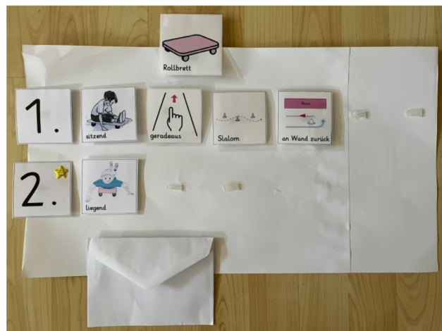
Abbildung 9: Instruktionsplan für die Station – Rollbrett (1. Runde des Stationsbetriebs)

Mittels einer Beobachtung von Kindern mit Migrationshintergrund in einer 2. Klasse in drei Sportstunden wurden unerwünschte Situationen aufgrund von Verständigungsschwierigkeiten dokumentiert. Der Structured TEACCHing Ansatz aus der Autismus-Spektrum-Forschung diente der Kategorisierung und Bewertung der Situationen. Anschließend wurden diese Ergebnisse genutzt, um ein Konzept für eine angepasste Sportstunde auf Grundlage des TEACCH Ansatzes zu erstellen. Hier kamen insbesondere strukturierende Visualisierungen durch Piktogramme zum Einsatz. Es konnte herausgestellt werden, dass die Durchführung dieser Sportstunde zu einer erwünschten Umsetzung der vorher als fehlerhaft identifizierten Situationen führte.