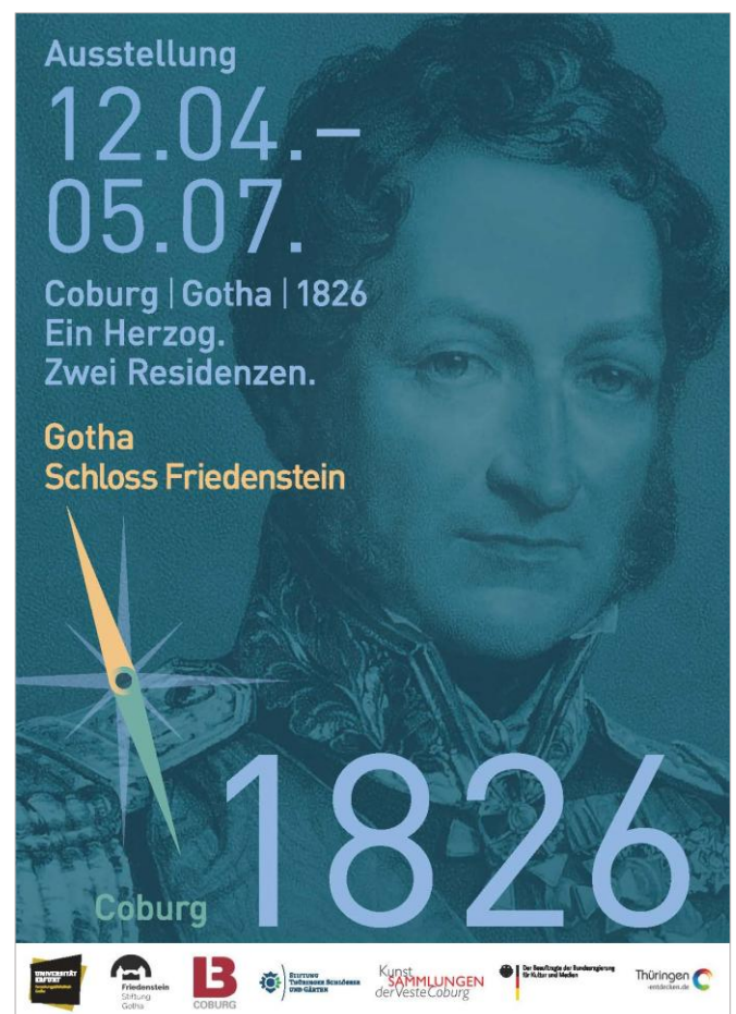
Plakat zur Ausstellung

Der Freundeskreis der Forschungsbibliothek Gotha e.V. feiert sein 20-jähriges Bestehen und lädt am Mittwoch, 29. April, um 18.00 Uhr zu einer Festveranstaltung in den Spiegelsaal der FBG ein. Seit zwei Jahrzehnten begleitet der