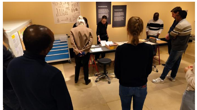
Besuch der sámischen Sammlung am Museum Europäischer Kulturen, Berlin