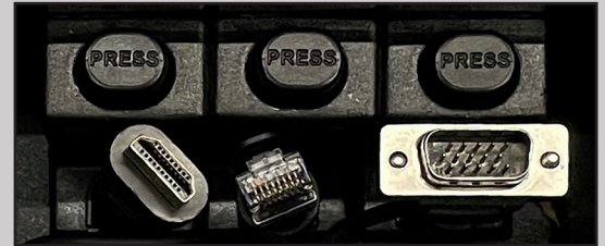
HDMI-, LAN-, VGA-Kabel