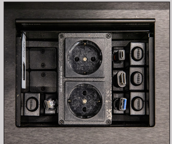
HDMI-, USB-C, USB, LAN-Kabel