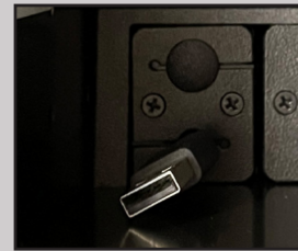
USB-Kabel für z.B. webex (Kamera+Mikros)