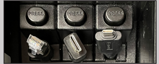
LAN-, HDMI-, USB-C-Kabel