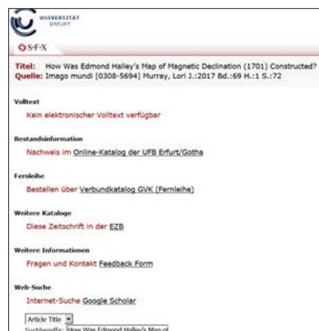
Abb.: Kontextsensitives SFX-Menü

Die Angaben der ursprünglich gesuchten Quelle werden immer aus der Datenbank übernommen; eine nochmalige Eingabe der Suchbegriffe ist nicht erforderlich.